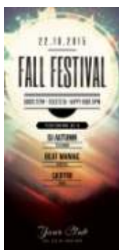
Página 01 (Impressão Frente)

***Caso seu arquivo possua verso, basta adicionar um páginas nas mesmas especificações da primeira***