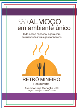
Página 01 (Impressão Frente)