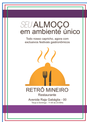
Página 01 (Impressão Frente)