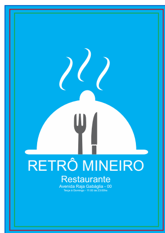
Página 02 (Impressão Verso)