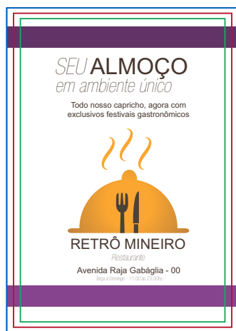
Página 01 (Impressão Frente)