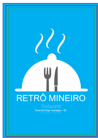
Página 02 (Impressão Verso)