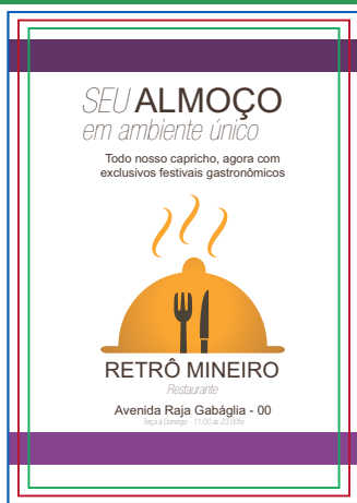
Página 01 (Impressão Frente)