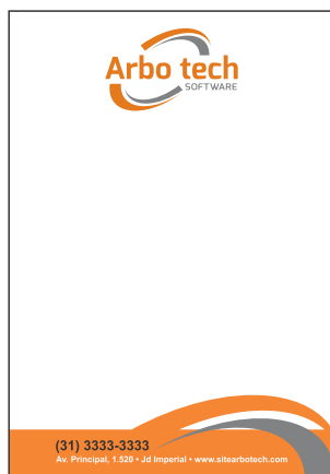
Página 01 (Impressão Frente)