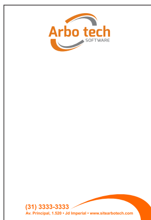
Página 2 - Verso