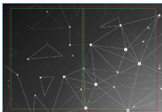
Página 2 Verso

Antes de Gerar o arquivo em PDF/X1-a para impressão, exclua todas as linhas do gabarito.