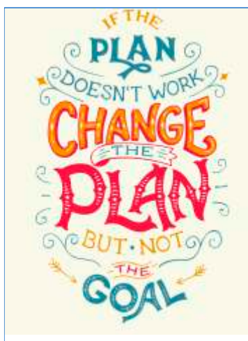
Página 01 Impressão