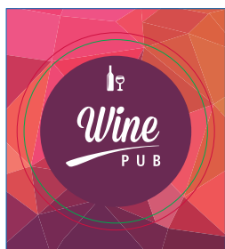
Pagina 01 Impressão Frente