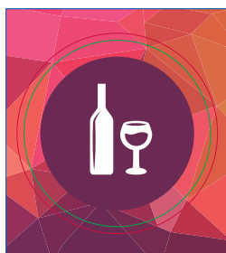
Pagina 02 Impressão Verso