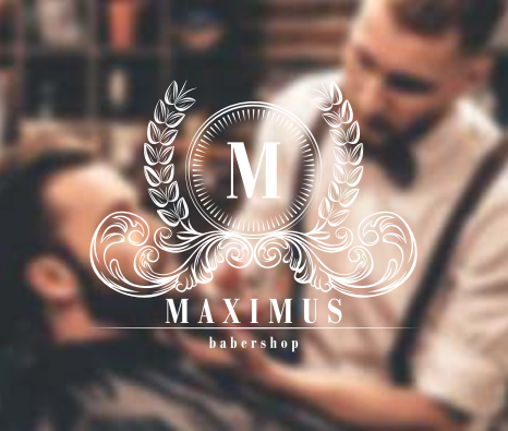
Página 01 (Frente)

Para serviços com faca (corte especial), deve-se apenas acrescentar 01 última página ao arquivo contendo o desenho de corte (vetorizado) com contorno 100% preto (K). O tamanho máximo para desenho da faca é 179x150mm. Evite desenhos complexos ou facas vazadas, este tipo de acabamento pode prejudicar o resultado final do seu produto.