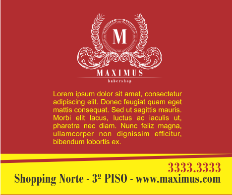
Página 02 (Verso)