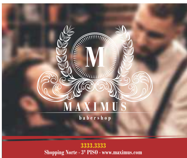
Página 1 - Frente

Veja abaixo como montar a sua arte para envio do seu arquivo