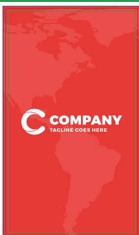
Página 1 - Frente

Veja abaixo como montar a sua arte para envio do seu arquivo