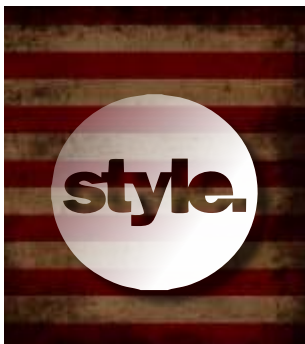
PÁGINA 1 - FRENTE