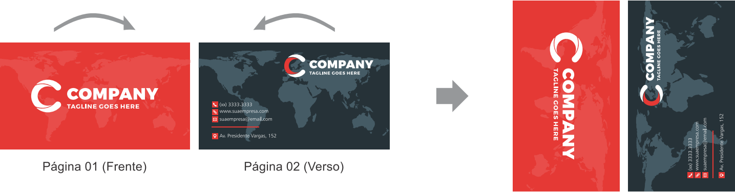
Página 01 (Frente) Página 02 (Verso) Página 01 (Frente) Página 02 (Verso)

A batida de verso é a orientação das páginas do seu arquivo e a forma que será "batida" a impressão do verso no seu material no momento da produção. Artes para postais devem sempre estar na vertical, ou seja, 91x153mm. Veja abaixo o exemplo para fazer sua batida de verso corretamente: