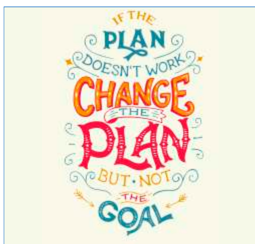
Página 01 Impressão