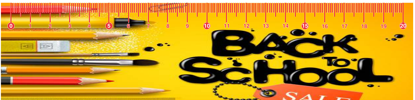
Página 1 - Frente