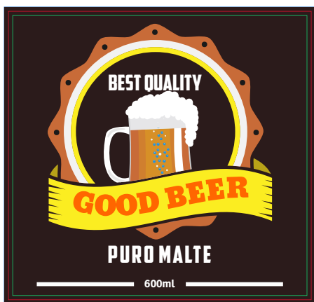
Página 1 - Frente