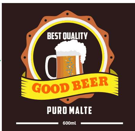
Delete as informações do gabarito