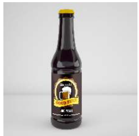
Amostra final do produto