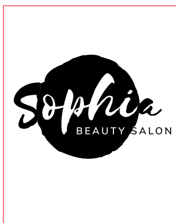
Página 1 (Impressão 100%K Vetorizada )