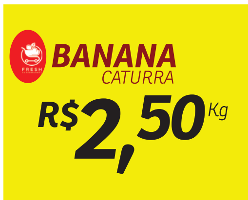
RETIRE TODAS AS INFORMAÇÕES DO GABARITO ANTES DO ENVIO PARA PRODUÇÃO