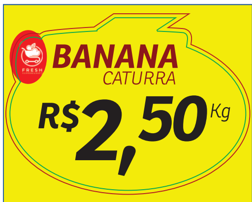
PÁGINA 1 - FRENTE