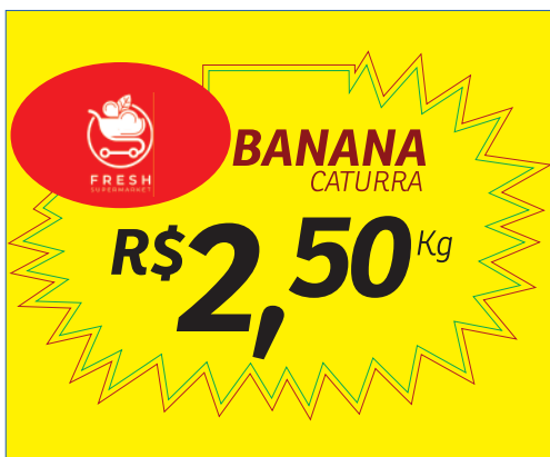
PÁGINA 1 - FRENTE