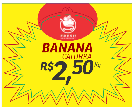
PÁGINA 1 - FRENTE