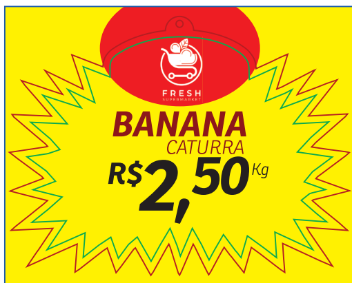
PÁGINA 1 - FRENTE