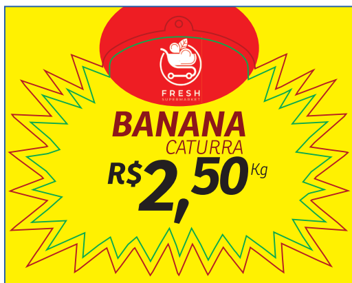
PÁGINA 1 - FRENTE