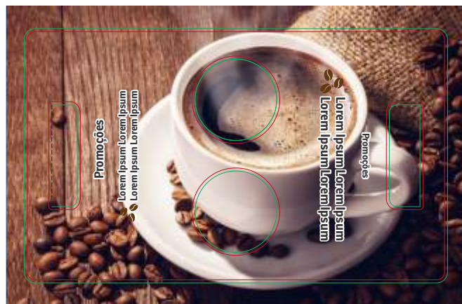
Página 2 - Verso