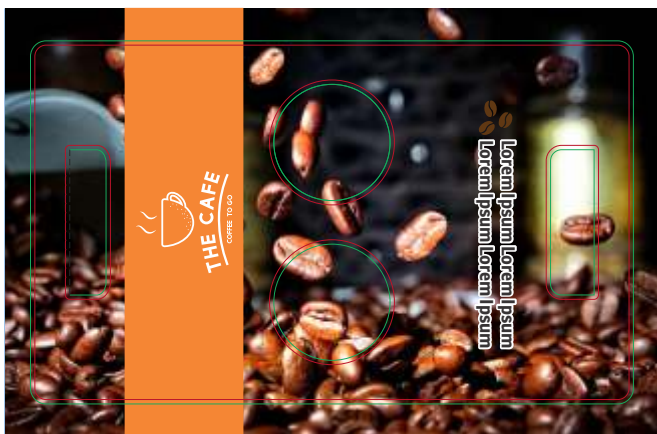
Página 1 - Frente

Veja abaixo como montar a sua arte para envio do seu arquivo