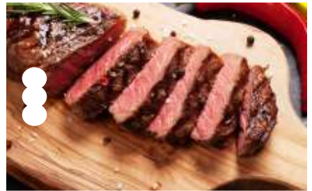
Produto Final com o dedal