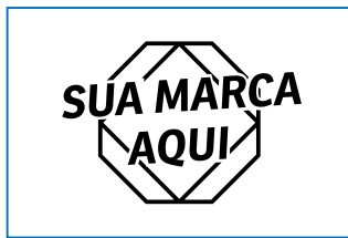
Página 2 - Verso

Envia sua a arte sem fundo para que seja impresso diretamente no capacho desejado.