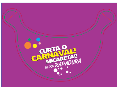
Página 01 Impressão

NÃO MUDE O POSICIONAMENTO DAS REFERÊNCIAS ACIMA. A FACA SERÁ BATIDA NA POSIÇÃO EM QUE ESTA NA PÁGINA. CASO TENHA DESLOCADO, «BAIXE» O GABARITO PELO SITE NOVAMENTE E REFAÇA A ARTE.