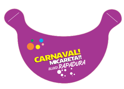
VISEIRA APÓS O CORTE DIMENSÕES DA ÁREA VERMELHA

Antes de Gerar o arquivo em PDF/X1-a para impressão, exclua todas as linhas do gabarito.